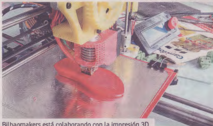
Bilbaomakers está colaborando con la impresión 3D.