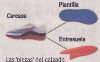
Las 'piezas' del calzado.

De forma paralela, The Open Shoes está desarrollando una campaña de crowdfunding ( www.goteo.org/project/the-open-shoes ), en la que colabora la Obra Social de la Caixa y en la que no sólo se